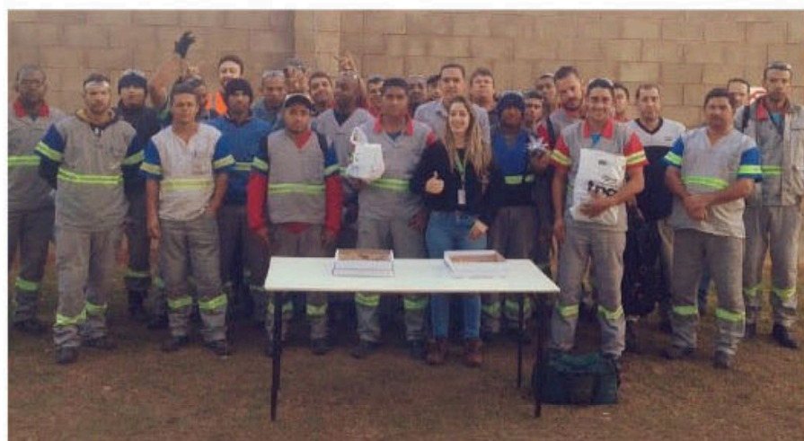
Sala Ribeirão – Motoristas da Distribuição